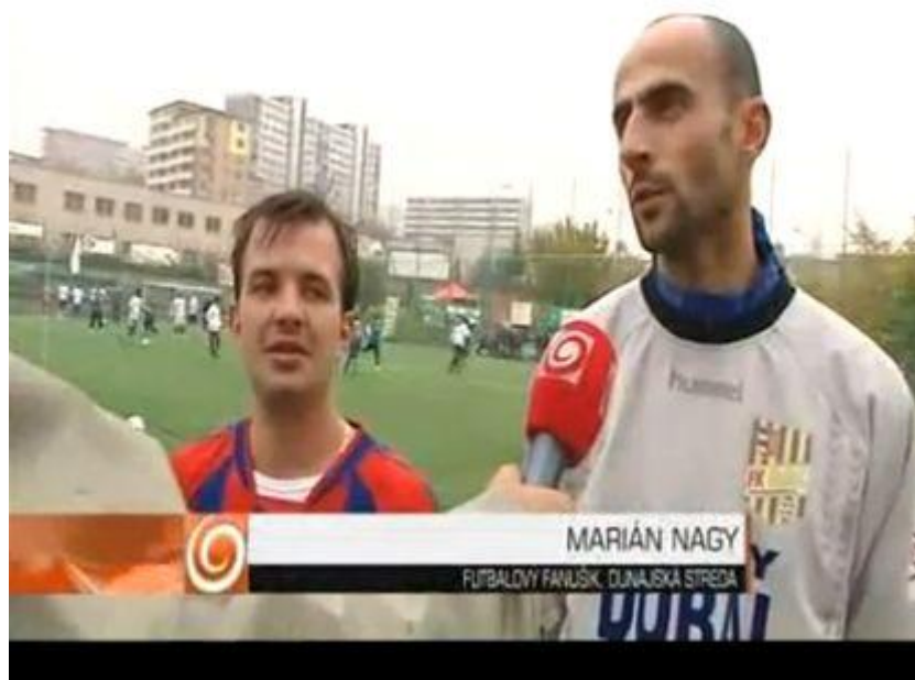
Kapitáni spoločného tímu fanúšikov slovenskej a maďarskej národnosti v jednom tíme.

Za pretrvávajúcu iniciatívu možno označiť spoločný projekt fanúšikov DAC Dunajská Streda a FK Senica, ktorý sa od roku 2009 spoločne usilujú o prekonávanie nacionalistických nálad (prítomných najmä počas zápasov DAC Dunajská Streda so Slovanom Bratislava či Spartakom Trnava) prostredníctvom priateľských zápasov a spoločných podujatí. Táto aktivita, začatá v minulej sezóne Corgoň Ligy, pokračovala aj v roku 2010 28 .