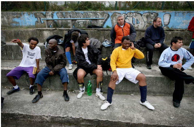
Výber imigrantov a cudzincov FUTBALOM K POROZUMENIU.

V Bratislave sa počas FARE Action Week 2010 konal už III. ročník turnaja BLMF a OZ ĽPR proti rasizmu a intolerancii. Tretí ročník bol doposiaľ aj najväčším čo dosvedčuje ako počet účastníkov (aj zahraničných), tak aj sprievodné akcie turnaja. 18