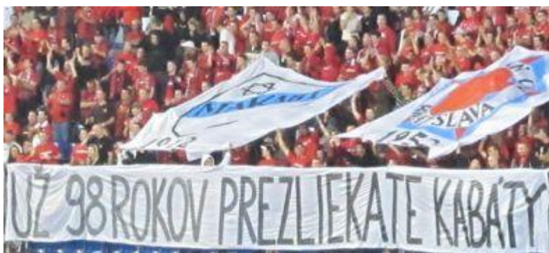
Transparent s Dávidovou hviezdou vľavo na derby Slovan Bratislava-Spartak Trnava. 10

V prípade posledného derby Slovan-Spartak sa však dá pozorovať skutočnosť, že adresátom týchto urážok už nie je "len" súperov tábor fanúšikov, ale v prípade pokrikov "Jude, jude, jude celá Blava" či vyššieho zmieneného pokriku "načo kukáte, kurvy židovské" je urážaným ktokoľvek bez rozdielu.